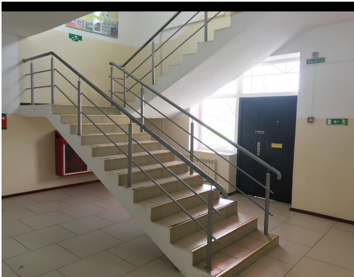
ФОТО №11 Лестница