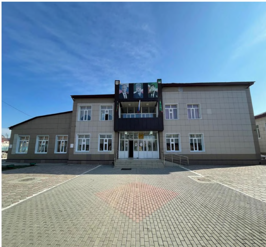
ФОТО №1 Вход на территорию