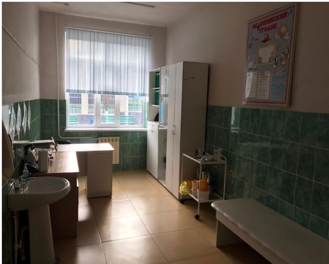
ФОТО №17 Кабинетная форма обслуживания