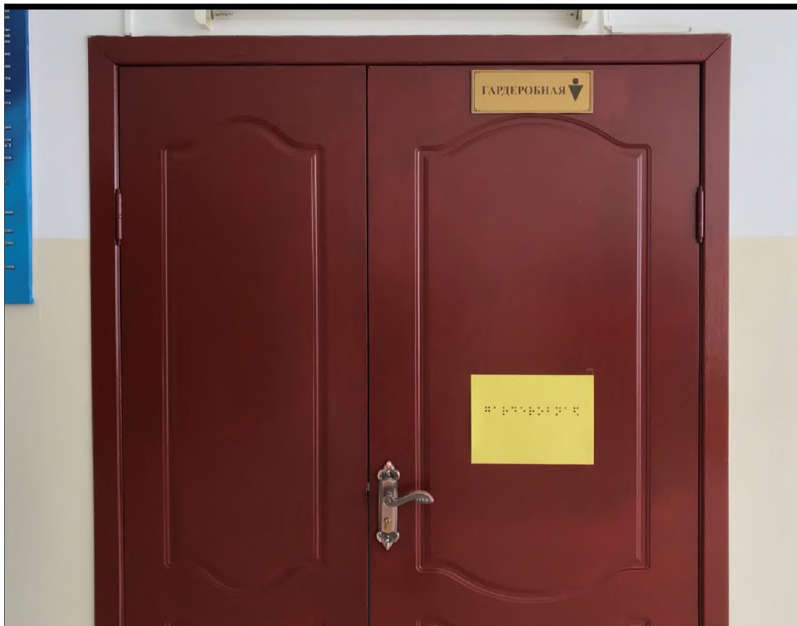
ФОТО №13 Дверь (внутренняя)