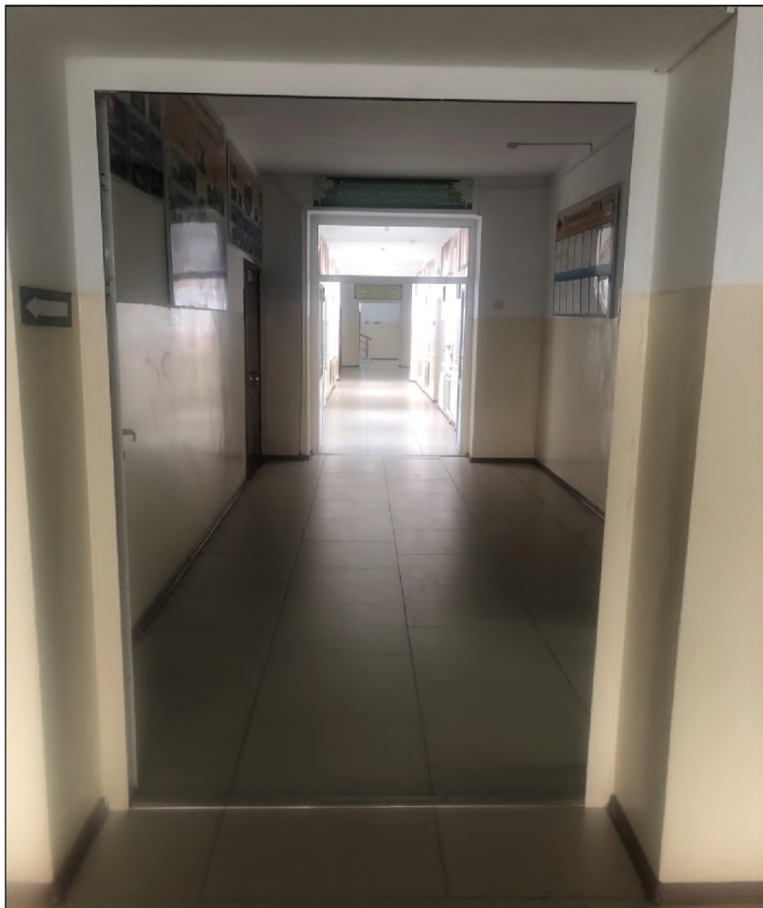
ФОТО №9 Коридор