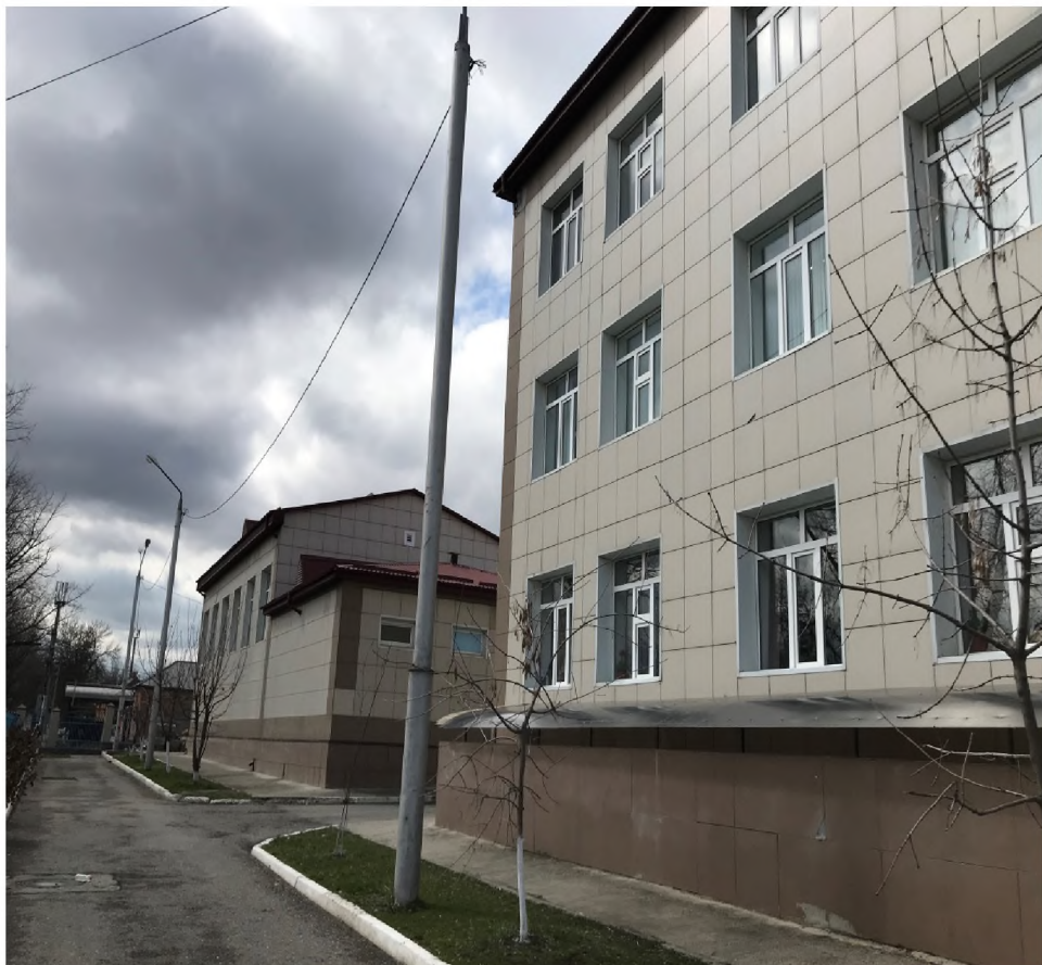
ФОТО №5 Путь (пути) движения на территории