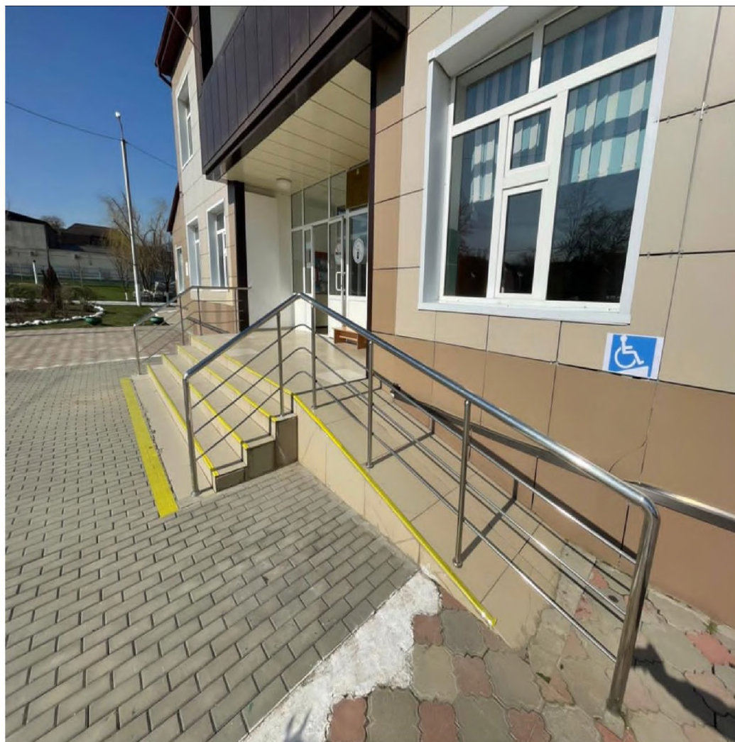
ФОТО №7 Лестница (наружная) Пандус (наружный)