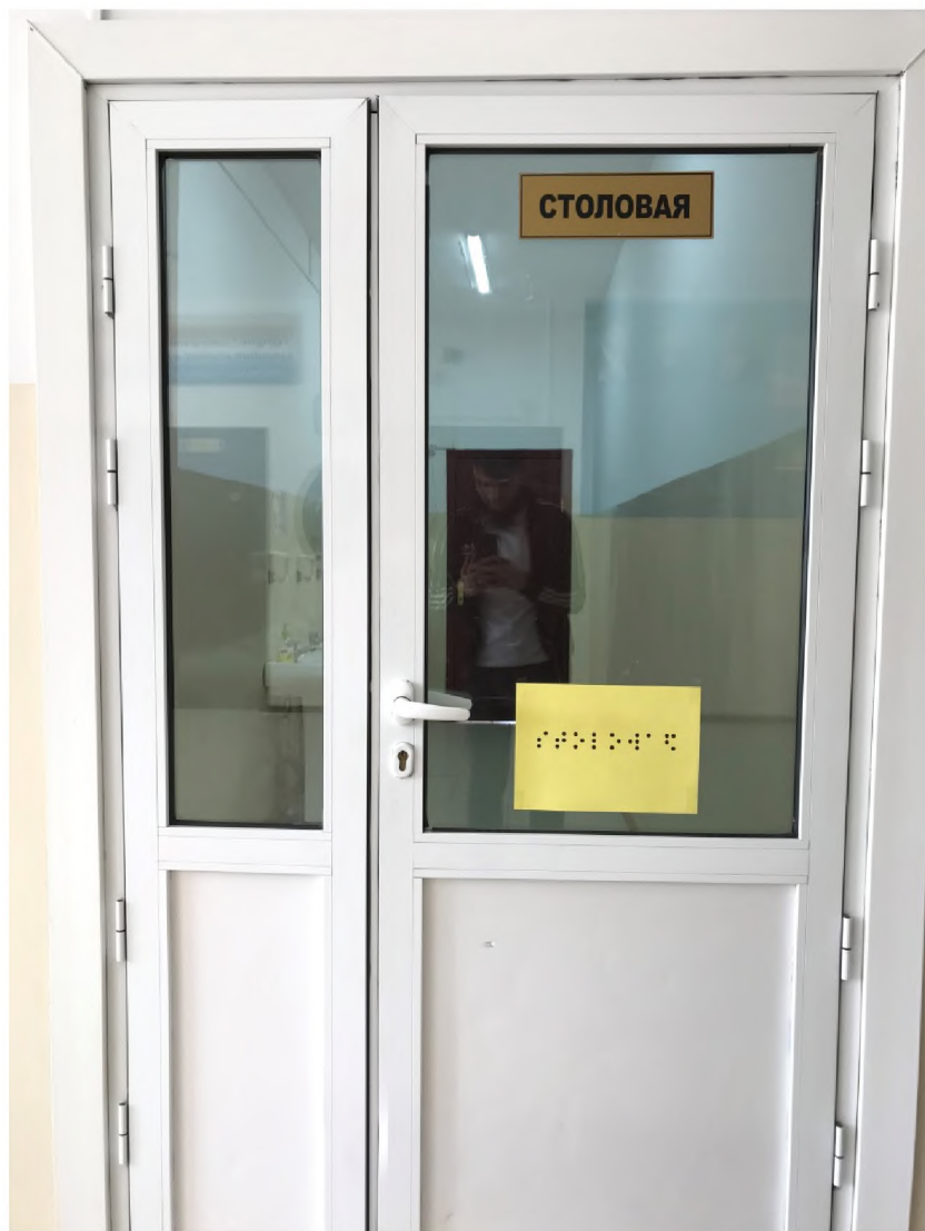
ФОТО №19 Столовая