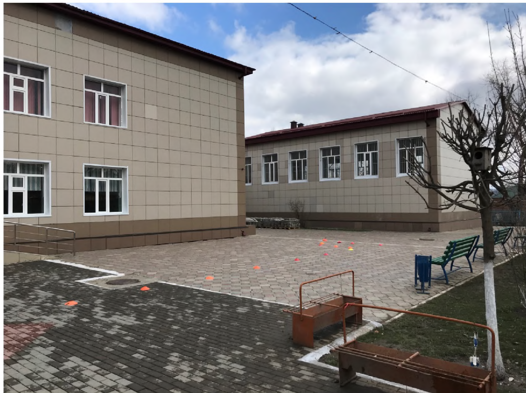
ФОТО №3 Путь (пути) движения на территории